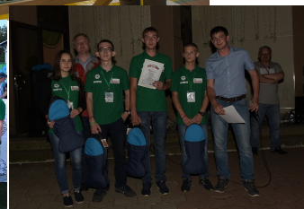
Акция "Голубь Мира"