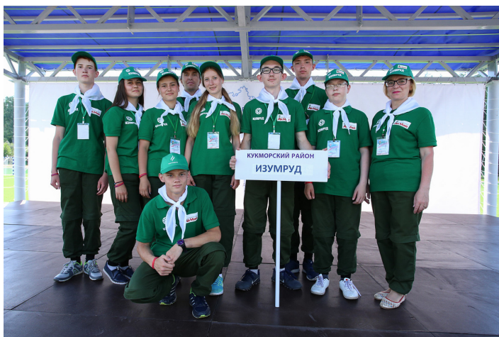
1 место на районном соревновании "Военизированный кросс"